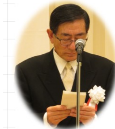
亀戸子ども会連合会