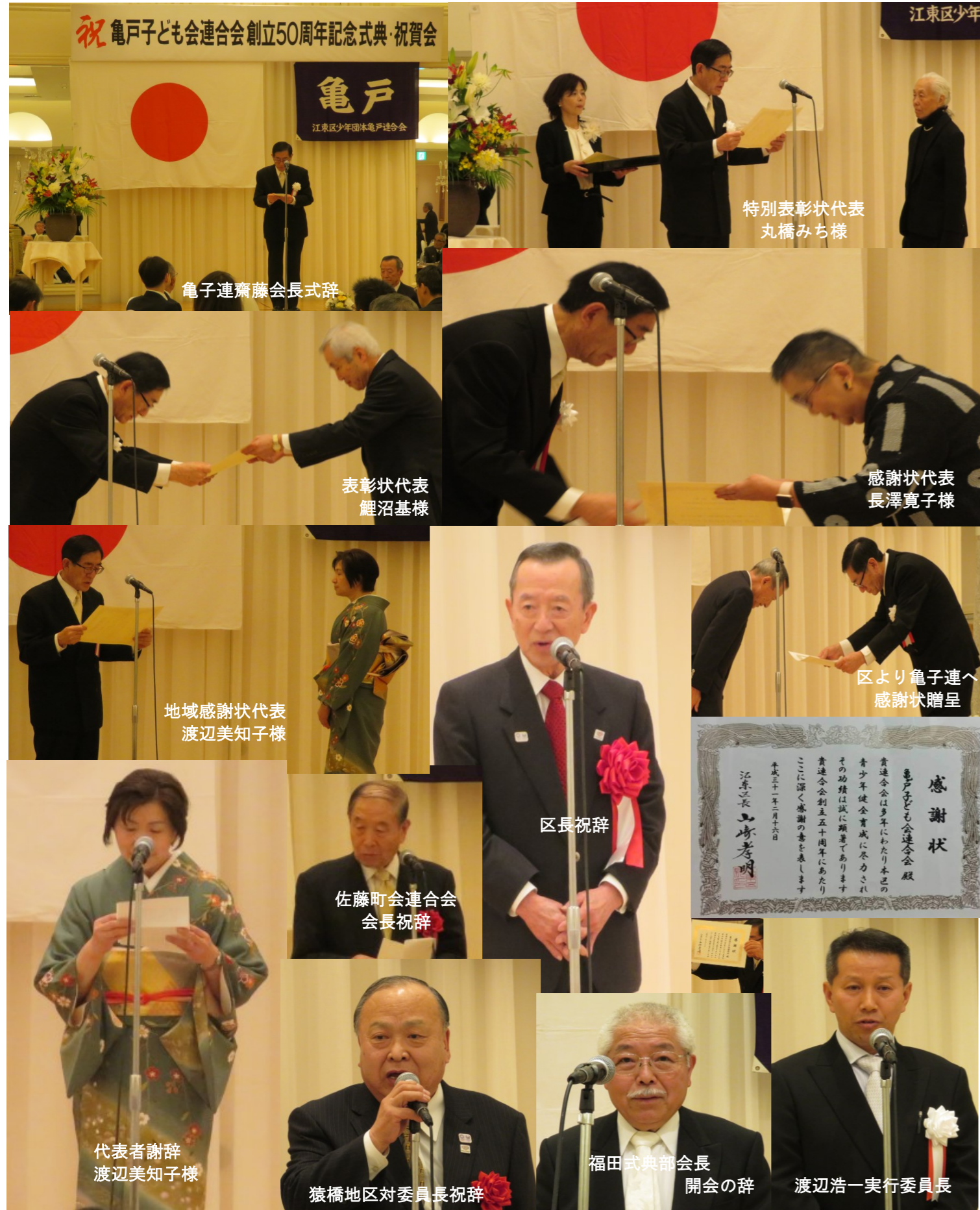
祝 亀戸子ども会連合会創立50周年記念式典・祝賀会